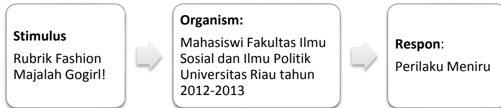
Gambar 2 Teori S-O-R dalam penelitian