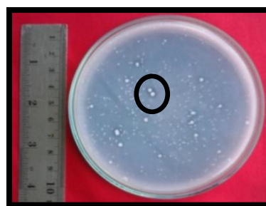
Gambar 3. Koloni BPF yang terdapat dalam biofertilizer cair.

Berdasarkan formula yang digunakan, bahwa mutu biofertilizer cair sangat bergantung pada keefektifan bakteri dan jumlah sel hidup yang terdapat di dalam biofertilizer cair tersebut (Simanungkalit et al. , 2006). Bakteri pelarut fosfat yang terkandung di dalam biofertilizer cair mampu melarutkan sumber P yang terikat ditandai dengan kemampuan BPF dalam menghasilkan zona bening disekitar koloni (Sylvia et al. , 2005). Untuk meyakinkan bahwa benar-benar BPF yang berkembang dalam biofertilizer cair yang diproduksi, maka pada setiap penghitungan populasi BPF diamati koloni BPF yang tampak. Gambar 3 menyajikan koloni BPF yang tumbuh dalam biofertilizer cair yang ditandai dengan terbentuknya zona bening di sekitar koloni.