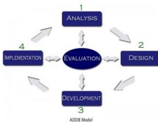
Gambar 1. Model ADDIE

Penelitian pengembangan media pembelajaran kimia menggunakan software Autoplay Media Studio 8 dilaksanakan di Fakultas Keguruan dan Ilmu Pendidikan (FKIP) Program Studi Pendidikan Kimia, dari bulan Mei 2016 - Juli 2016. Jenis penelitian adalah penelitian pengembangan. Penelitian pengembangan menggunakan model ADDIE ( Analysis, Design, Development, Implementation, Evaluation ). Tahapan dari model ADDIE dapat dilihat pada gambar 1 berikut ini: