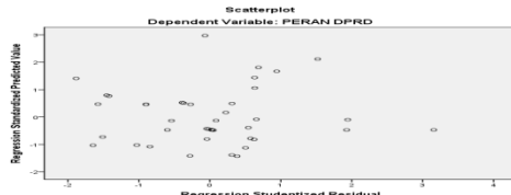
Gambar 3 Hasil Uji Heterokedastisitas

Pada penelitian ini, terlihat bahwa titik-titik tidak membentuk pola tertentu dan menyebar pada sumbu Y.