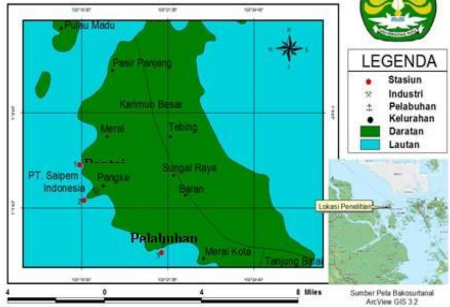
Gambar1. Lokasi Penelitian

Sampel air laut diambil sebanyak 500 ml dengan menggunakan botol pada setiap titik sampling. Sampel air laut yang diambil selanjutnya dimasukkan ke dalam kontainer botol plastik polietilen yang telah dibilas 3 kali dengan air laut. Kemudian ditambahkan dengan asam nitrat ( \text{HNO}_3 ) pekat (3 mL \text{HNO}_3 /L sampel air), selanjutnya dimasukkan ke dalam ice box dan dibawa ke laboratorium untuk dianalisis. Sedangkan sampel sedimen diambil dengan menggunakan Eckman Grab sebanyak 500 gr berat basah dan kemudian dimasukkan ke dalam kontainer kantong plastik yang telah diberi label berdasarkan titik samplingnya. Sampel ini dimasukkan ke dalam ice box dan selanjutnya dibawa ke laboratorium untuk dianalisis.